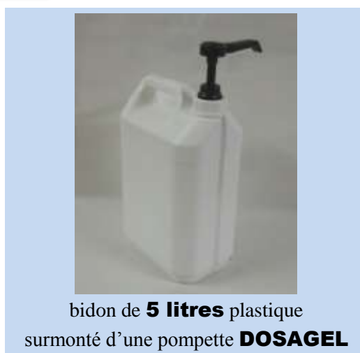
bidon de 5 litres plastique surmonté d'une pompette DOSAGEL