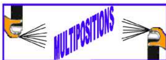
UTILISATION POSSIBLE EN PULVERISATION TETE EN HAUT OU TETE EN BAS

→ AEROSOL UTILISABLE EN TOUTES POSITIONS.