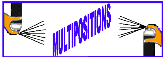
UTILISATION POSSIBLE EN PULVÉRISATION TETE EN HAUT OU TETE EN BAS

Renouveler selon nécessité et état de la surface.